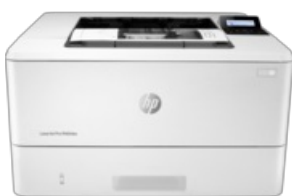
Virado para o centro

54 x 41 (jpg) 54 x 41 (png) 96 x 72 (jpg) 96 x 72 (png) 99 x 74 (png) 153 x 115 (png) 180 x 135 (png) 240 x 180 (jpg) 240 x 180 (png) 247 x 185 (png) 257 x 193 (png) 320 x 240 (jpg) 320 x 240 (png) 474 x 356 (png) 513 x 385 (png) 573 x 430 (png) 1659 x 1246 (png) 2511 x 1604 (png)