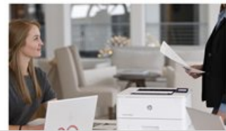
HP LaserJet Pro M404 - Desktop Hot Button Dynamic - 4