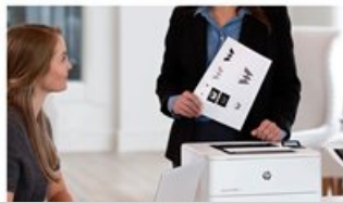
HP LaserJet Pro M404 - Desktop Hot Button Dynamic - 3