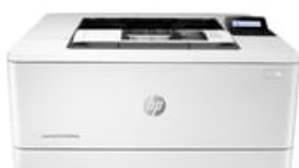
Virado para o centro

54 x 41 (jpg) 54 x 41 (png) 96 x 72 (jpg) 96 x 72 (png) 99 x 74 (png) 153 x 115 (png) 180 x 135 (png) 240 x 180 (jpg) 240 x 180 (png) 247 x 185 (png) 257 x 193 (png) 320 x 240 (jpg) 320 x 240 (png) 474 x 356 (png) 513 x 385 (png) 573 x 430 (png) 1659 x 1246 (png) 2511 x 1604 (png)