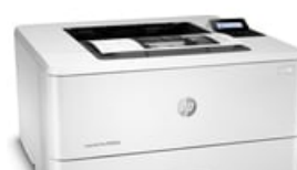
Para a direita

54 x 41 (jpg) 54 x 41 (png) 96 x 72 (jpg) 96 x 72 (png) 99 x 74 (png) 153 x 115 (png) 180 x 135 (png) 240 x 180 (jpg) 240 x 180 (png) 247 x 185 (png) 257 x 193 (png) 320 x 240 (jpg) 320 x 240 (png) 474 x 356 (png) 513 x 385 (png) 573 x 430 (png) 1659 x 1246 (png) 4459 x 3008 (png)