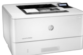
Para a direita

100 x 70 (jpg) 170 x 190 (jpg) 400 x 400 (jpg) 400 x 400 (png) 800 x 600 (png) 1500 x 1597 (jpg) 3247 x 2396 (jpg)