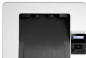
Vista superior fechada

54 x 41 (jpg) 54 x 41 (png) 96 x 72 (jpg) 96 x 72 (png) 99 x 74 (png) 153 x 115 (png) 180 x 135 (png) 240 x 180 (jpg) 240 x 180 (png) 247 x 185 (png) 257 x 193 (png) 320 x 240 (jpg) 320 x 240 (png) 474 x 356 (png) 513 x 385 (png) 573 x 430 (png) 1659 x 1246 (png) 2638 x 2512 (png)