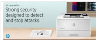
HP LaserJet Pro M404 - Desktop - KSP Module