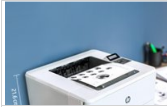
HP LaserJet Pro M404 - Carousel - 7