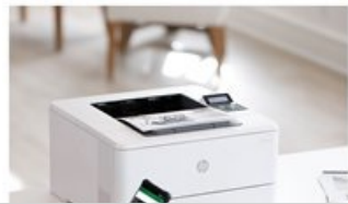
HP LaserJet Pro M404 - Desktop Hot Button Dynamic - 2