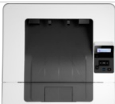
Vista superior fechada

54 x 41 (jpg) 54 x 41 (png) 96 x 72 (jpg) 96 x 72 (png) 99 x 74 (png) 153 x 115 (png) 180 x 135 (png) 240 x 180 (jpg) 240 x 180 (png) 247 x 185 (png) 257 x 193 (png) 320 x 240 (jpg) 320 x 240 (png) 474 x 356 (png) 513 x 385 (png) 573 x 430 (png) 1659 x 1246 (png) 2638 x 2512 (png)