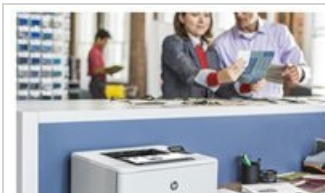
HP LaserJet Pro M404 - Desktop Hot Button Dynamic - 1