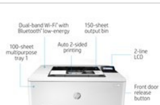
HP LaserJet Pro M404 - Hot Button Static - 2