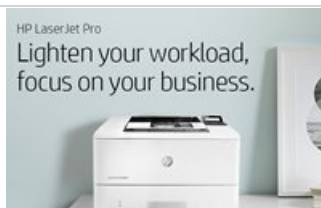
HP LaserJet Pro M404 - Mobile - Hero Banner