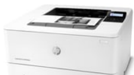
Virado para a esquerda

54 x 41 (jpg) 54 x 41 (png) 96 x 72 (jpg) 96 x 72 (png) 99 x 74 (png) 153 x 115 (png) 180 x 135 (png) 240 x 180 (jpg) 240 x 180 (png) 247 x 185 (png) 257 x 193 (png) 320 x 240 (jpg) 320 x 240 (png) 474 x 356 (png) 513 x 385 (png) 573 x 430 (png) 1659 x 1246 (png) 3166 x 2243 (png)