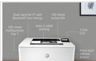
HP LaserJet Pro M404 - Hot Button Static - 1