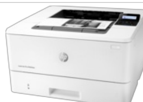
Virado para a esquerda

100 x 70 (jpg) 170 x 190 (jpg) 400 x 400 (jpg) 400 x 400 (png) 800 x 600 (png) 1500 x 1703 (jpg) 2536 x 1766 (jpg)