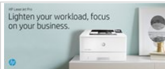
HP LaserJet Pro M404 - Desktop - Hero Banner