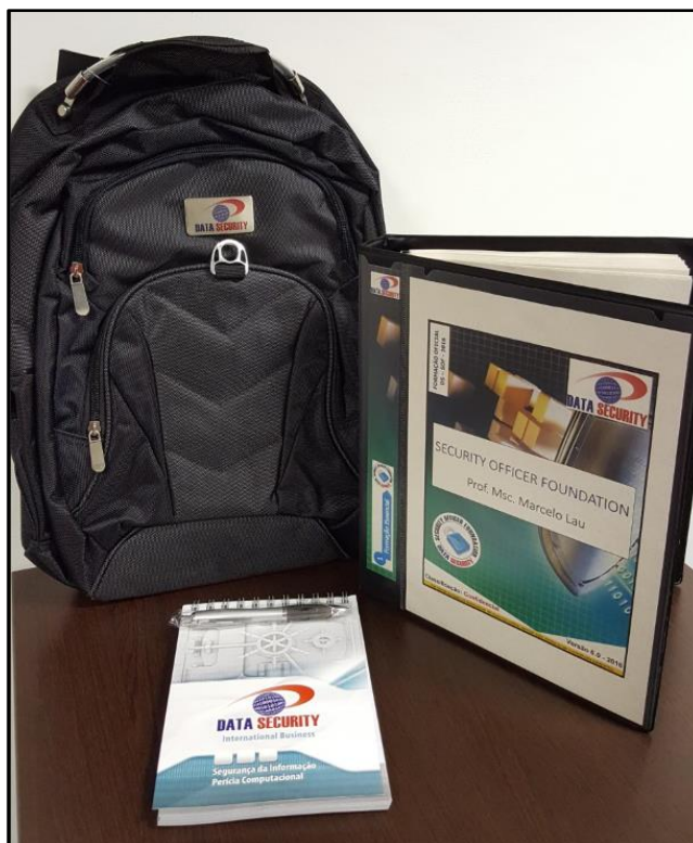
Figura 2: Exemplo do kit entregue ao aluno (Material Didático).

Calendário e horários a serem acordados entre as partes COREN e DATA SECURITY .