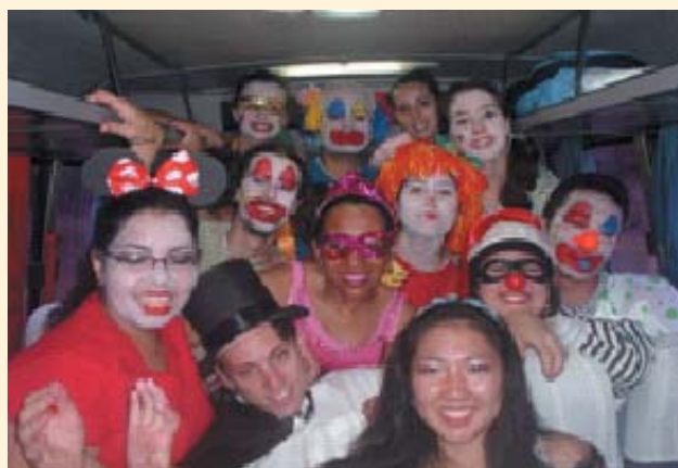
Equipe de estudantes e profissionais que compõe o projeto Cananéia

Não há como falar em enfermagem voluntária e não falar sobre a Cruz Vermelha que está presente em 176 países em todo o mundo, numa rede humanitária global que envolve quase 100 milhões de membros. Um exemplo de trabalhos voluntários é o “Projeto Cananéia”, que teve início, a partir de um convênio entre a Prefeitura Municipal da cidade e a Universidade Federal de São Paulo - UNIFESP, contando com a participação de docentes dos Departamentos de Enfermagem e Medicina Preventiva da Universidade.